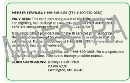
(Anverso de la tarjeta de identificación)